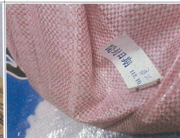
說明：乾料開封會標註開封日期