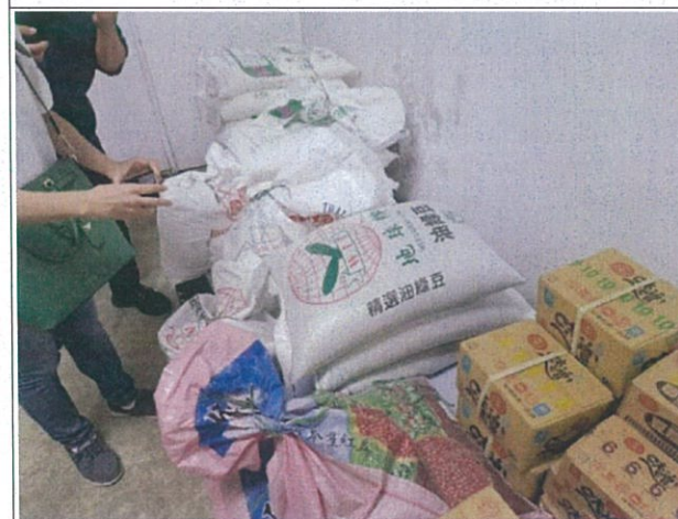
說明：乾料庫房內物品皆離牆離地