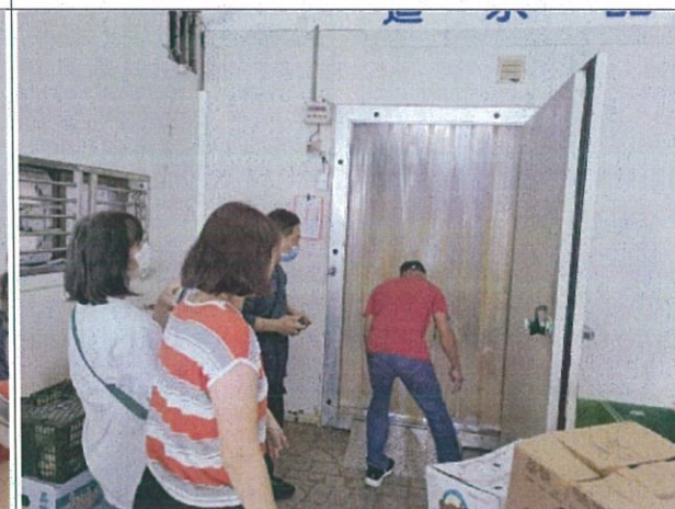
說明：入口處設有防蠅簾