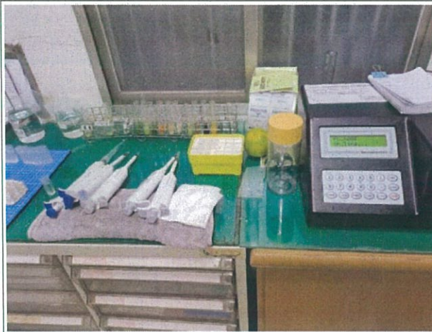
說明：檢驗室檢驗設備介紹