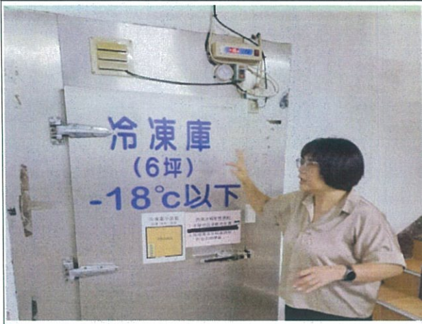
說明：冷凍室入口，室內須保持-18°C 以下