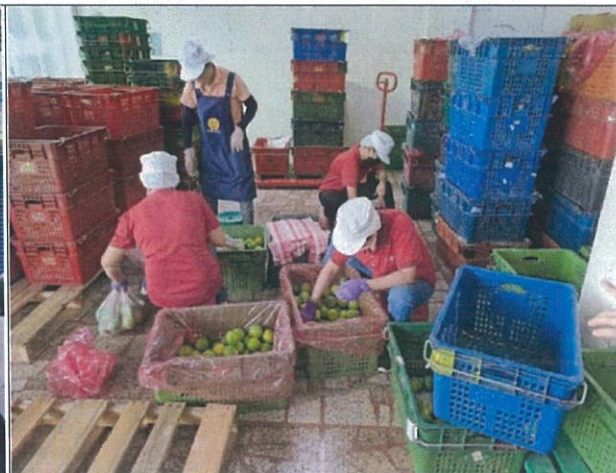
說明：廚工正在挑選水果及分好數量