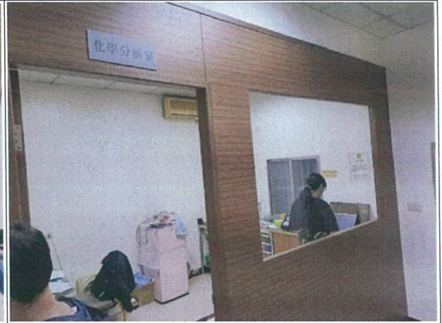
說明：化學分析室介紹及檢驗設備