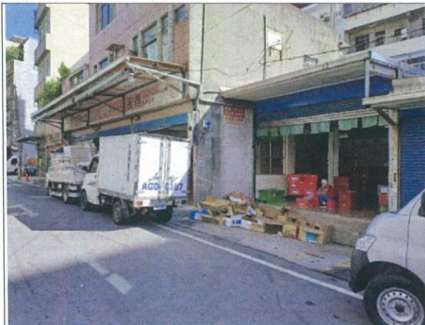
說明：永得公司大門