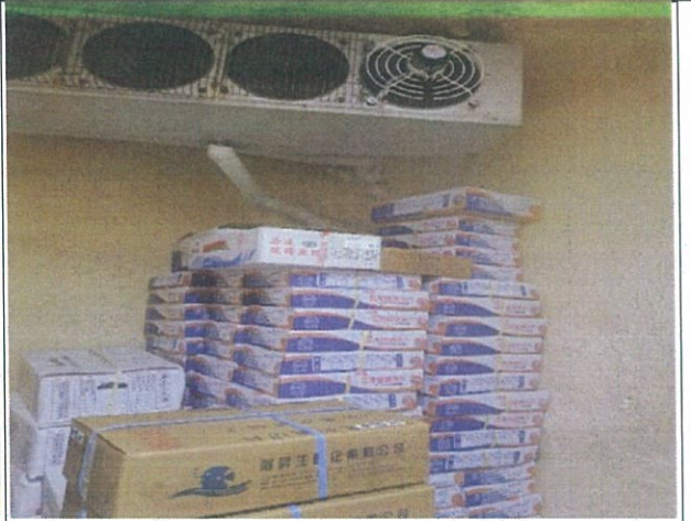
說明：冷凍室內食材擺放情形