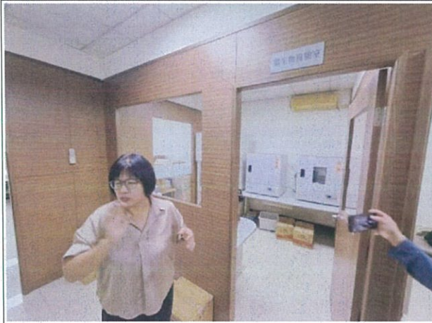
說明：微生物檢驗室介紹及檢驗設備