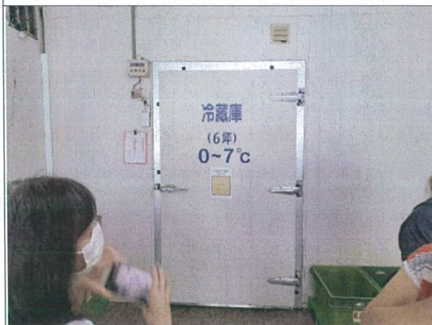
說明：冷藏室入口，室內須保持 0~7°C